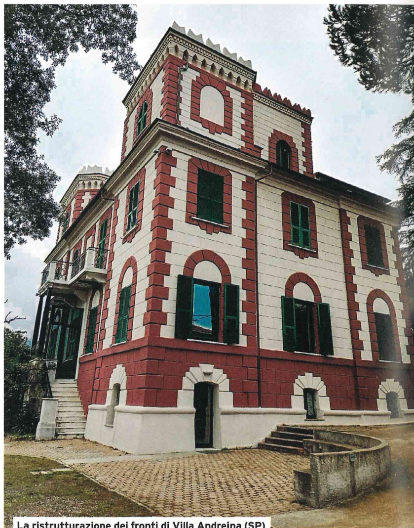
La ristrutturazione dei fronti di Villa Andreina (SP)

Grazie anche agli incentivi in essere, e recentemente prorogati seppur con differenti modalità di attuazione, condomini e proprietari singoli hanno intrapreso sia opere di riqualificazione