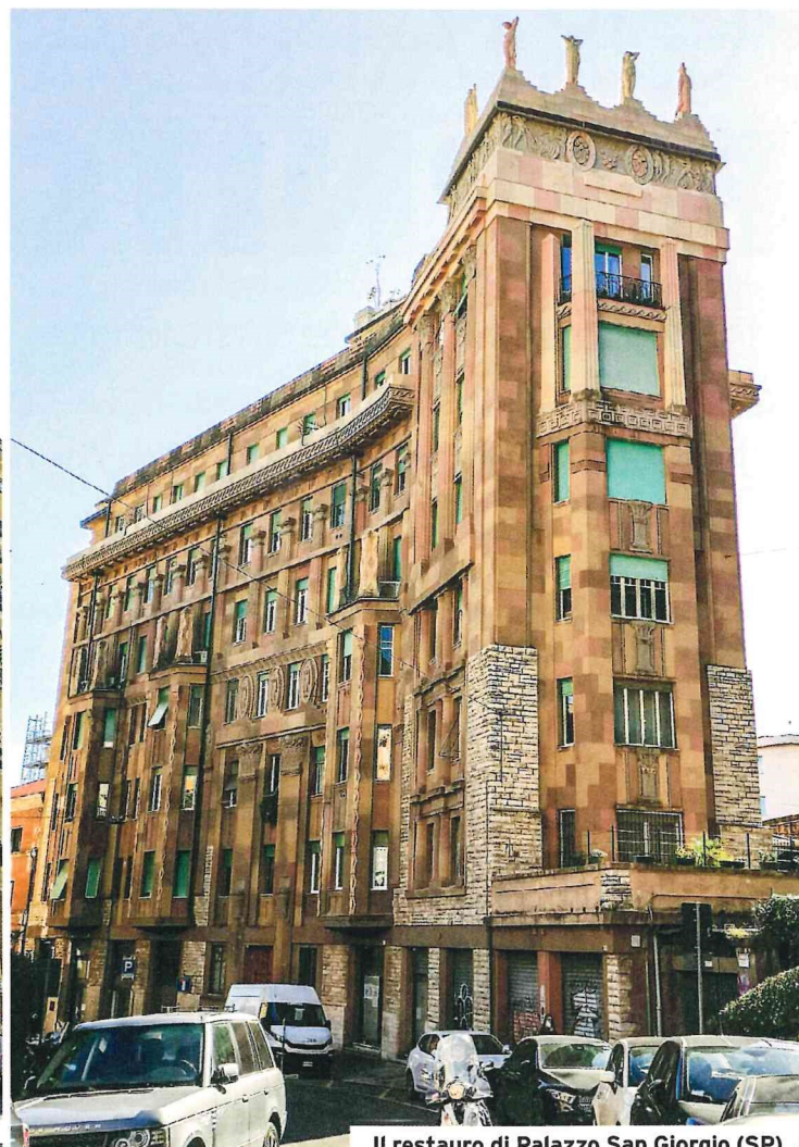
Il restauro di Palazzo San Giorgio (SP)